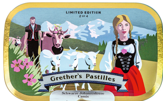
Montée à l'alpage dans l'Oberland bernois devant la célèbre chaîne de montagnes formée par l'Eiger, le Mönch et la Jungfrau.