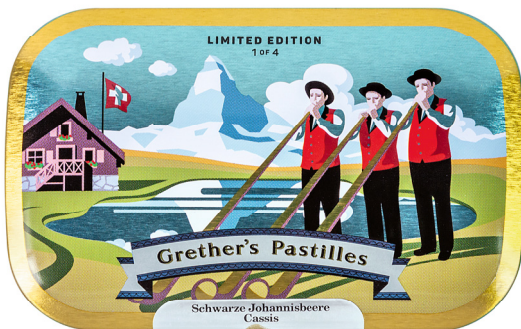
Trio de cors des Alpes lors de la prière vespérale devant le panorama du Mont Cervin.

Le concept a été créé par l'illustratrice bâloise Patrizia Stalder. Ses portraits lui ont valu une présence dans la publication «200 Best Illustrators Worldwide 18/19» du célèbre Lürzer's Archive. Et Patrizia Stalder de déclarer à ce sujet: «La particularité de ce projet était de donner un style propre aux sujets traditionnels». Ainsi, un hommage à la Suisse est né.